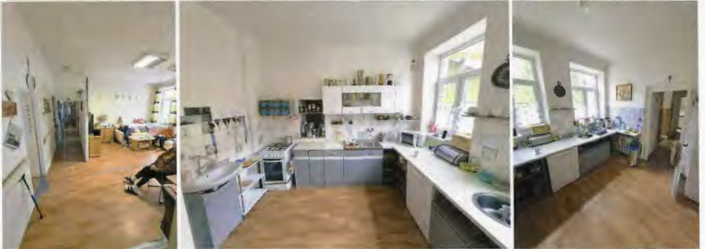
Schody do suterénu a interiér suterénu budovy