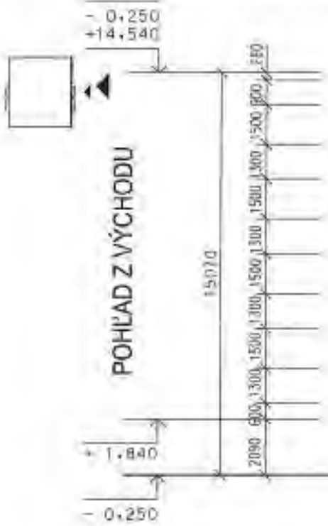
POHLED Z VÝCHODU