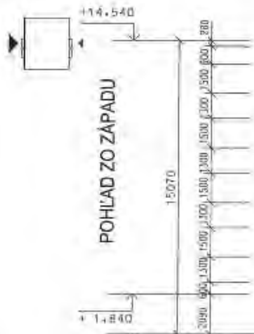
POHLED Z ZÁPADU