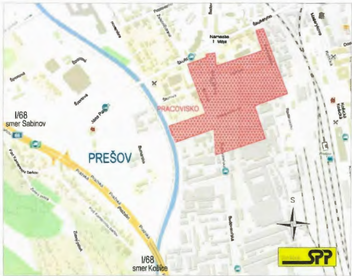
REKONŠTRUKCIA PLYNOVODOV PREŠOV, ŠTÚROVA